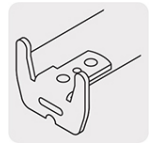
Gancho doble (excepto FA-3M)