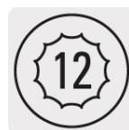
Puntas para tuercas hexagonales y cuadradas